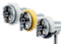
Tubi e innesti per gas vari da p. 155